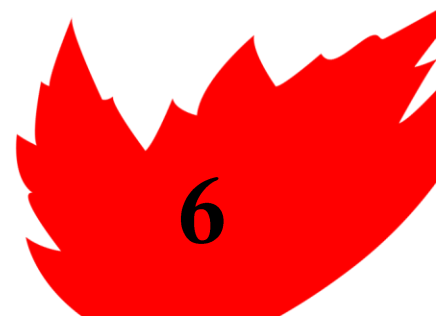
Figure 5 Extrait de la charte graphique de Maple Agency