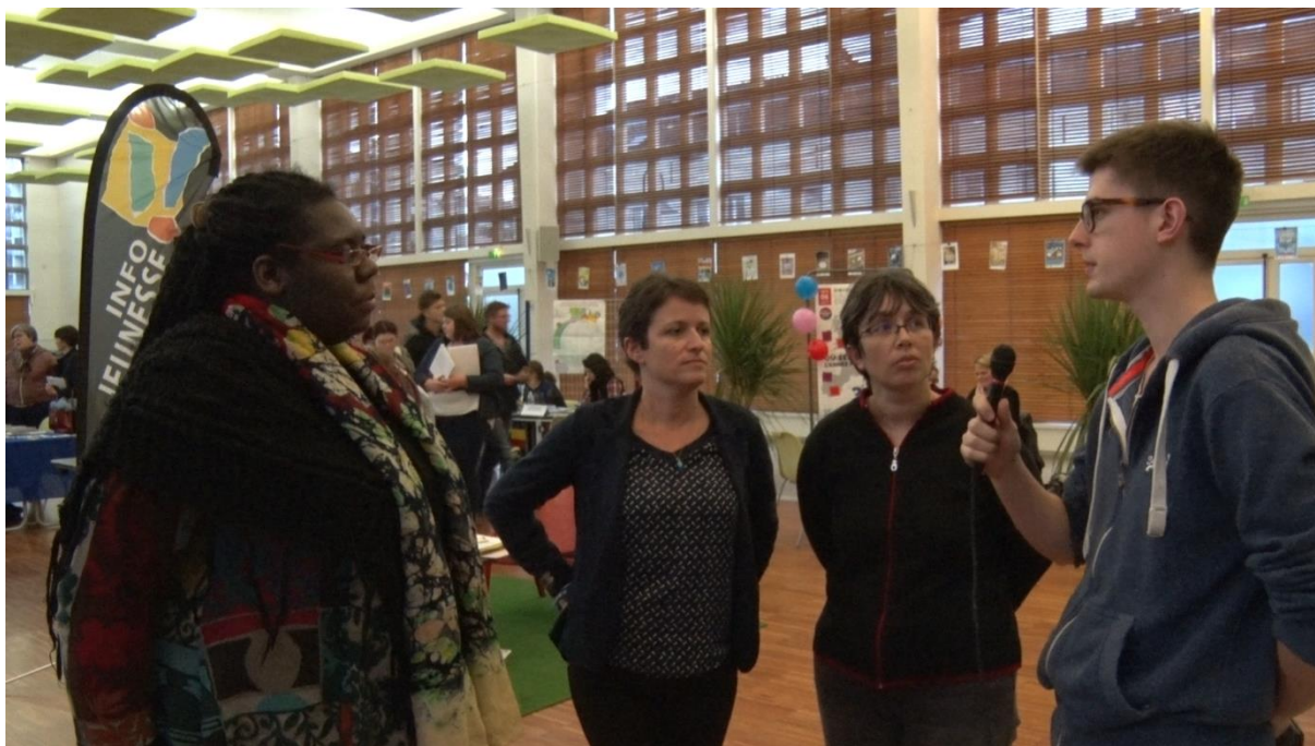
Figure 2 Capture d'écran de l'interview des trois organisatrices du forum