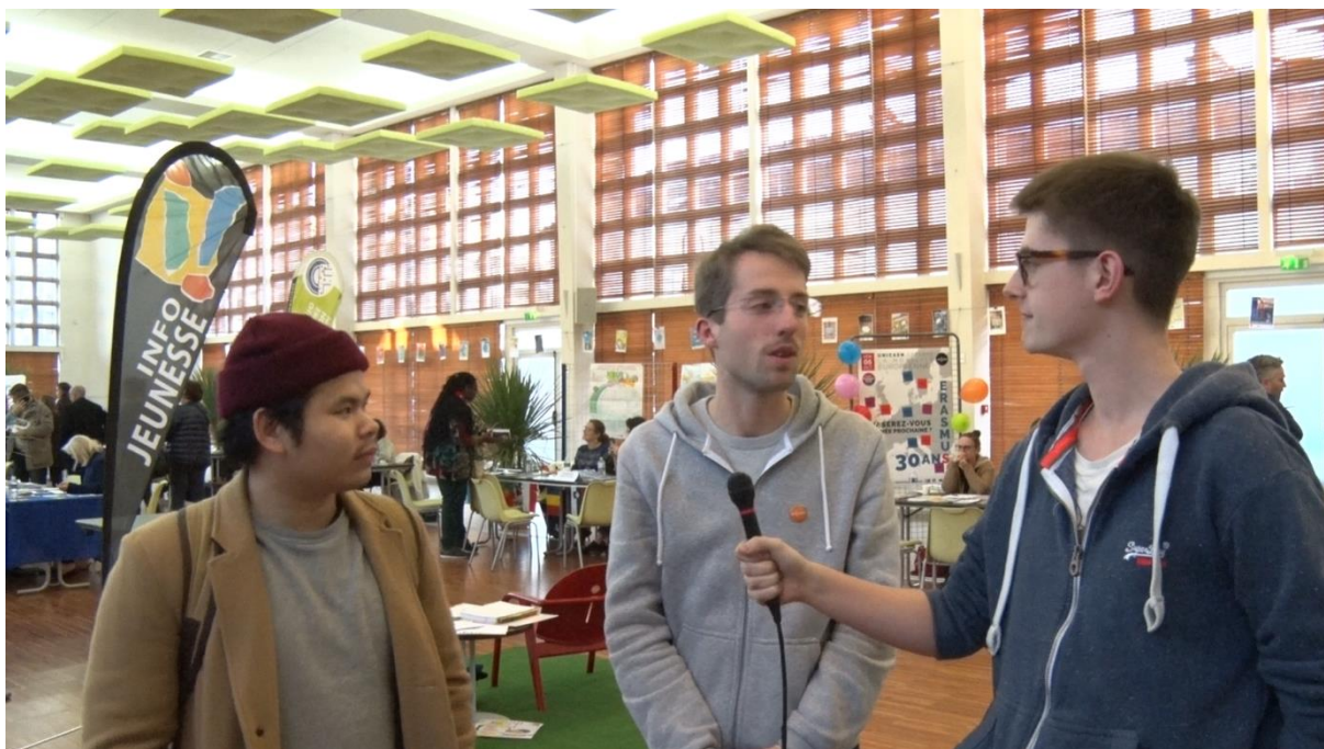
Figure 3 Interview de deux étudiants venus se renseigner lors du forum